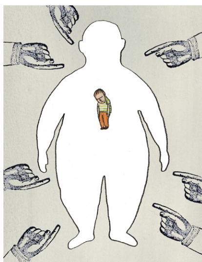
Illustration fra bogen