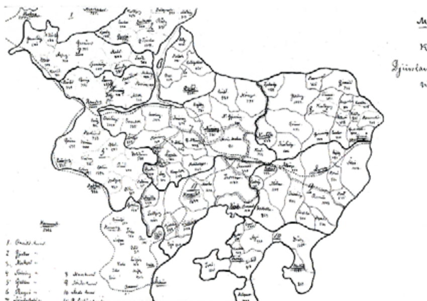
Kort over Djurslands Lægeforenings virkeområde fra maj 1896.

Foreningen blev grundlagt i 1883. Den 9. november blev