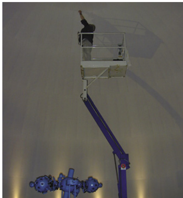
Reparation af kuppelplader.

Leverandøren af kuplen, Carl Zeiss Jena, undersøgte igennem en meget lang periode sagen og besluttede at skifte aluminiumspladerne ud, da man ikke kunne finde fejlen. Ved et tilfælde blev det tyske malerfirma under ombygningen opmærksomme på nogle rester af hærder og fortynder, som vi har haft stående siden monteringen af den oprindelige kuppel, og man opdagede, at der har været brugt en forkert hærder. Det får os til at håbe på, at den nye kuppeloverflade holder i mange år. Da der var tale om en garantisag, har forløbet kun kostet os