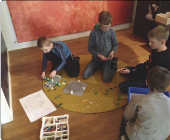
Der blev bygget ivrigt med LEGO rundt på museet.

Museets formidlere fortalte om Andreas, om turen ud i rummet, om vægtløshed og andre spændende ting for at give børnene de bedste forudsætninger for at arbejde med emnet. Og det var nogle meget engagerede børn, der gik i gang med at tegne storyboard og bygge modeller i LEGO, som ramme for deres små filmfortællinger.