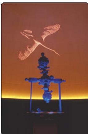
Stjernebilledet Svanen kan ses på sommerhimlen.

Steno Museet holder åbent hele sommerferien og har aktiviteter for hele familien. De mindste kan lave astronauttræning og tegne deres eget rum-missionslogo, og til de lidt større kan man for 5 kr. købe hæftet Astronord med aktiviteter om stjerner og planeter både på museet og derhjemme. I udstillingen findes den inter-