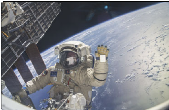
Den russiske kosmonaut Sergey Ryazanskiy er her fotograferet den 9. november 2013, medens han udfører vedligeholdelsesarbejder på ISS.

I forbindelse med, at Danmarks første astronaut, Andreas Mogensen, sendes ud til rumstationen ISS i september, har Steno Museet fokus på rummet og astronomi i hele 2015. I uge 37 og 38 kan skoleelever komme på besøg på museet og arbejde med astronomi, vægtløshed og livet som astronaut i det gratis forløb Rummet kalder.