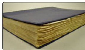
Opslagsværk over, hvordan man producerede bestemte produkter beregnet til medicinframstilling.

Selve det at læse om apoteket og dets historie var en interessant oplevelse, som lærte mig meget, jeg ikke vidste før, f.eks. at apoteket for nogle hundrede år siden også havde lov til at