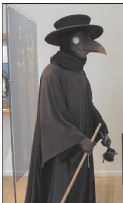
Ikke en fabelfigur fra "Ringenes Herre", men 1600-tallets pestlæge.

det overhovedet kunne lade sig gøre, men det har man altså en tendens til at se stort på, når man præsenteres for resultatet.