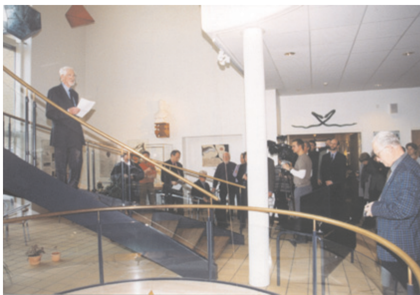
Nobelpristager Jens Chr. Skou på museets naturlige talerstol: trappen omkring pendulet.

Som prismodtager bliver man pludselig en person, hvis meninger man lytter til. Også selv om emnet ligger uden for ens fagområde. JCS nævnte det overraskende i at få besked om, at man var blevet indvalgt i fremmede viden-