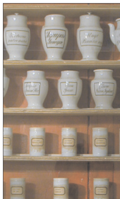
Hvide porcelænskrukker på hylderne i Det Gamle Apotek.

Til sidst skal nævnes det gamle apotek. Der var hylder fyldt med hvide porcelænskrukker og en stor messingvægt på disken. Den mindede os naturligvis om vores egen Justitia, og vi følte os med det samme hjemme. Det var