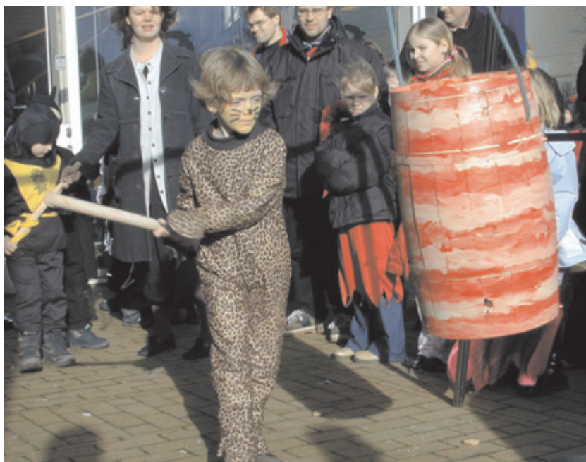
Mange flot udklædte børn var mødt op til tøndeslagning på Steno Museet.

Der var gratis adgang til museet mellem kl. 11 og kl. 13. Det blev en succes med mange flot udklædte børn, og der blev kåret kattekonger og kattedronninger i de to aldersgrupper 0-6 år og 7-12 år. Det er absolut et af de arrangementer, som vi vil prøve at gentage. Denne dag havde museet i alt 390 besøgende gæster.