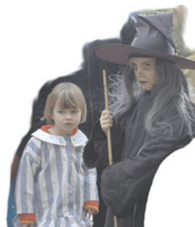
Et par af de flot udklædte deltagere ved fastelavnsfesten på Steno Museet.