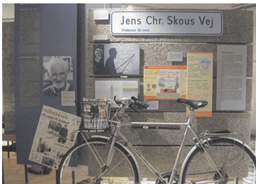
Jens Chr. Skou kom cyklende til Universitetets fest for ham ved udnævnelsen. Hans uundværlige cykel kan ses i udstillingen.

JCS mener, at prisen sætter fokus på naturvidenskabelig forskning, som kan være nyttig i en tid, hvor man ønsker mere tilgang til de naturvidenskabelige fag. Dette understreges af den udstilling, der åbnes her i dag.