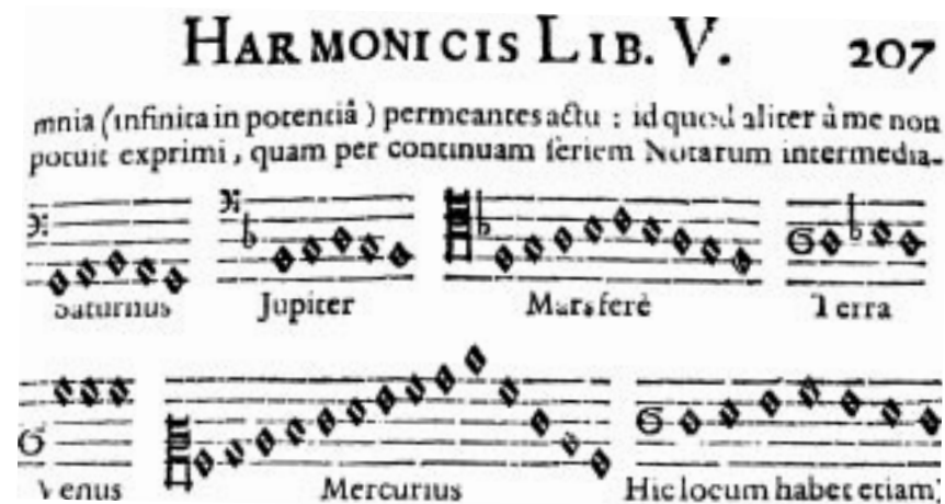
I 1600-tallet brugte Kepler musikalske skalaer i forsøget på at forstå solsystemets opbygning

Udstillingsåbninger er normalt lukkede arrangementer med særligt inviterede gæster. Men denne gang har vi valgt at gøre det offentligt. Steno Museets Venner såvel som andre interesserede inviteres derfor til at overvære åbningen og høre noget jazzmusik. hb