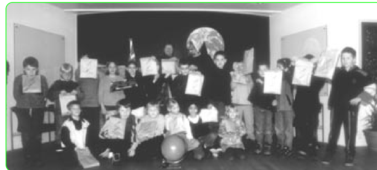
2. A fra Grønløkkeskolen i Tranbjerg fik lykkeposer og en stjerneglobus som Steno Museets „gæst nr. 200.000“.

stjernehimlen som tema, og at de havde valgt at afslutte med at se planetariets specielle børneforestilling. Til hvert barn var der desuden en lykkepose med ting fra museets butik. bt