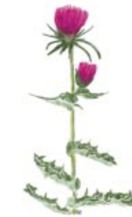
Marietidsel. Akvarel af Lisa Rasmussen.

En del planter bærer artsnavnet, officinalis , hvilket betyder „anvendelig som lægeplante“. De har været anvendt til medicin fremstilling på et „officin“ = apotek. Mange planters indholdsstoffer har været grundlaget for den medicin, der fremstilles idag. I det omfang haven